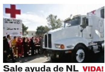
Sale ayuda de NL VIDA!